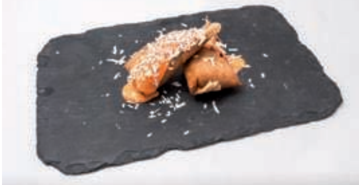
CROQUETA DIFERENTE CON JAMÓN Y CREMA DE PIQUILLO

Horario ruta: de lunes a domingo de 12:30h a 16h y de 20h a 23:30h